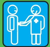
medico & prestazioni infermieristiche

RISCHIO · PERICOLO · RISCHIO · PERICOLO · RISCHIO · PERICOLO... ...con sangue · sperma · secrezione vaginale · latte materno