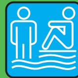
piscina & sauna