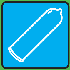
secco con profilattico