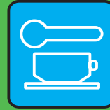
mangiare & bere insieme