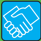
stringere le mani

NESSUN RISCHIO · NESSUN PROBLEMA · NESSUN RISCHIO · NESSUN PROBLEMA