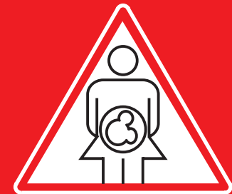
mamma verso figlio (parto, allattamento)