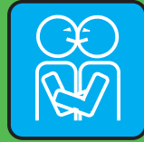
baci & abbracci